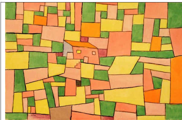
Σπίτι στην εσοχή

Αρχικά θα δούμε έναν πίνακα του ζωγράφου Πάουλ Κλέε (Paul Klee):