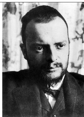
Πάουλ Κλέε ( ο ζωγράφος του πίνακα)